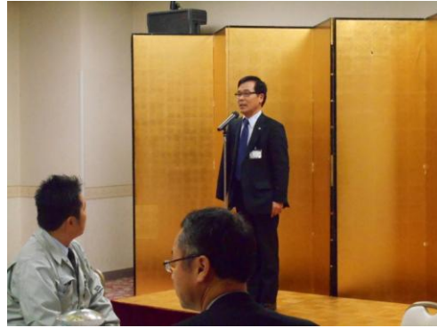
しまね産業振興財団 広野副理事長