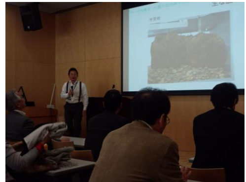
出雲古代歴史博物館