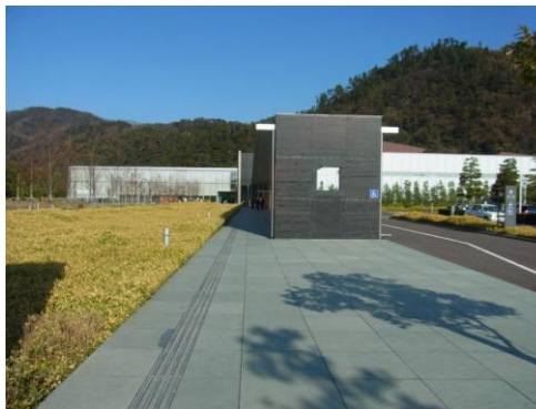
出雲古代歴史博物館